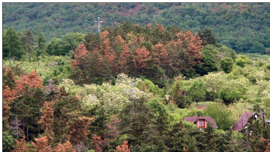
Tülevélbarnulásos tömeges lábbon száradás a Mátrában 2013-ban