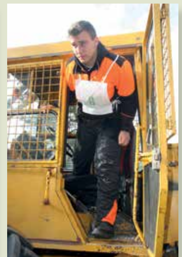
A közelítés végén