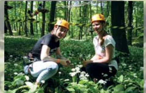
Kalocsai középiskolások a medvehagymásban