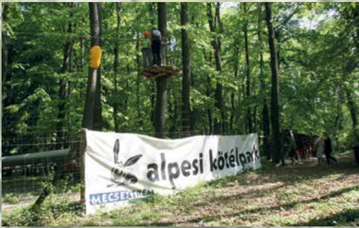
A Mecsextrem – Alpesi kötelpark