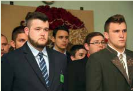
Az ásoththalmi versenyzők