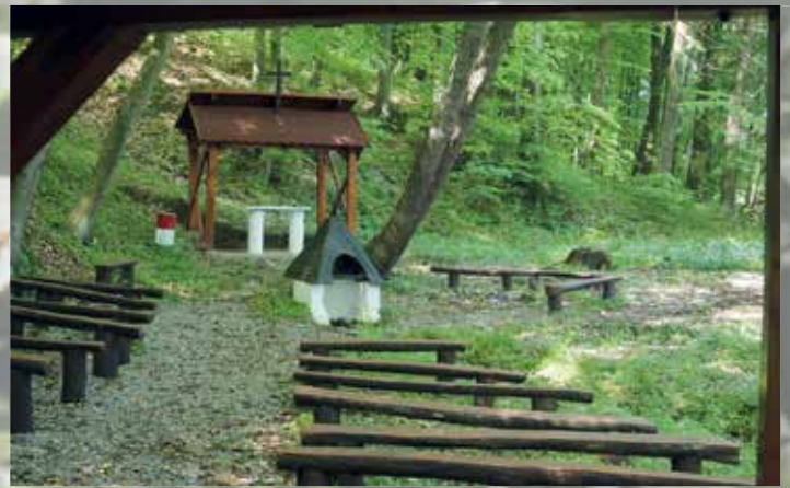
Szent István forrás