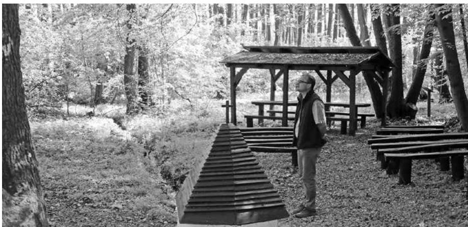
A Szent István forrásnál