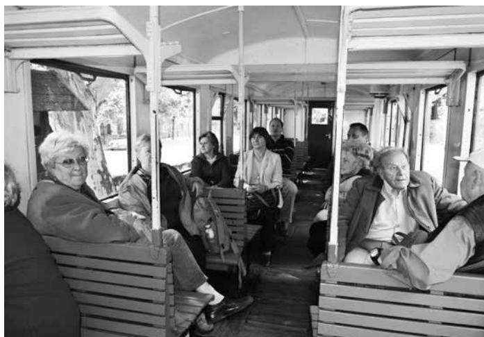
Az erdei vasúton

Az ösvény mellett sok információs tábla ismerteti az élővilágot, mely felhívja a figyelmet a védett fajokra is, és az azokkal való bánásmódra. Igazolt, hogy megjelent a területen a medve, a farkas, a vadmacska és a hiúz is. Az erdészetben a legfontosabb feladat az erdőfelújítási terv végrehaj-