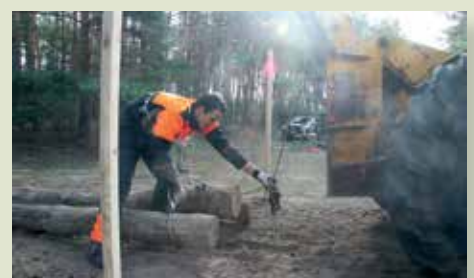
A rönk akasztása a közelítőre