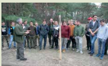
Verseny előtti eligazítás