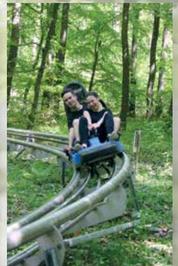
Az erdei bobbálya