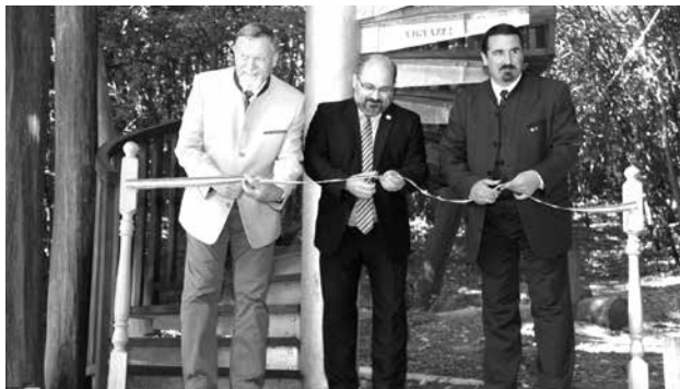
Lombkorona sétány avatásán

nem tartalmaz semmi mást, mint gyümölcsöt. Tartósítószer, ízfokozó, édesítőszer nincs benne. Évi 150 ezer liternél jönne ki nullára, de ezt a mennyiséget még nem értük el. A magántermelőkkel nem tudunk versenyezni a támogatások miatt. Ma már szinte minden községben van egy ilyen üzem. Korábban bérmunkát is vállaltunk, sok szőlőt dolgoztunk föl.