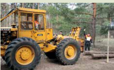
Munkában a közelítő páros