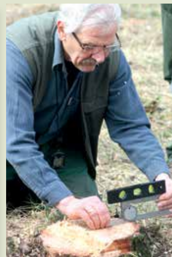
A döntés bírálata