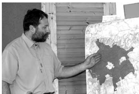
Még a pécsváradai támaszponton

ErFa Hír: – Új beosztásban milyen a munkamegosztás a vezérigazgató és ön között?