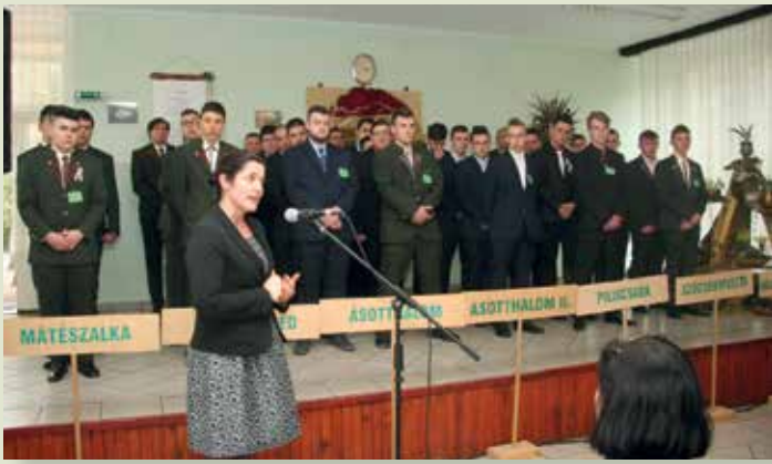
A záró ünnepély megnyitója