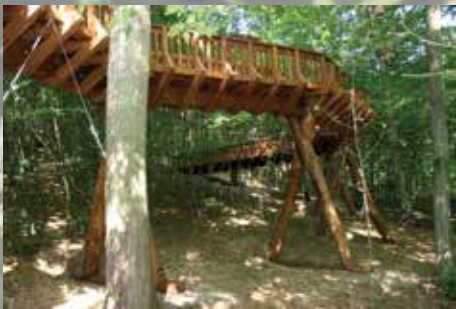
Lombkorona sétány Sasréten