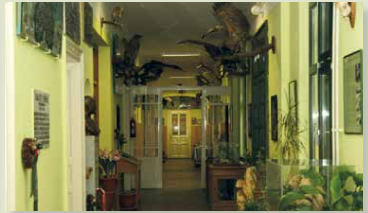
A főépület varázslatos hangulata