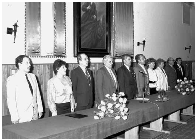
A MEDOSZ elnökségi ülése

12 normál ürméter ágfára vagy készlet hiányában ugyanannyi vékony dorongfára (botfára) volt jogosult, ha a munkavállaló 40 m 3 faanyagot bármilyen választékká feldolgozott, vagy pedig 40 napon