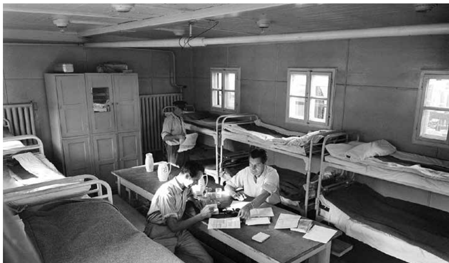
Erdészeti lakóhajó a Dunán

A szociálpolitikai főosztály foglalkozott az erdészek „csereenyaraltásával” is. Őszi, téli hónapokban a központi igazgatóság egy-egy családja erdészeket látott