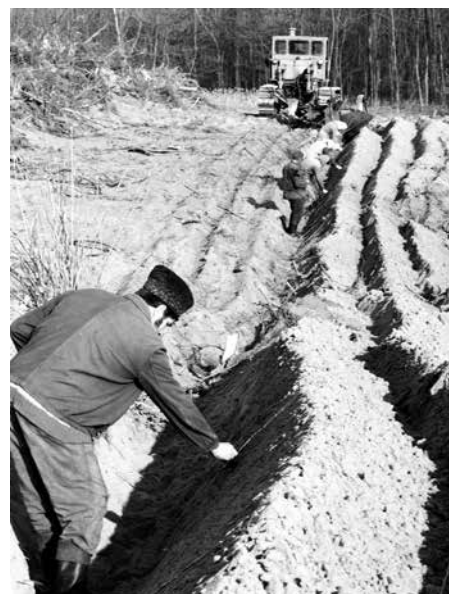
Erdőfelújítás a Kiskunságban

„Az MTA Erdészeti Bizottsága képviselőiben és erdőmérnök társaink nevében tisztelettel felkérjük, hogy vállalja el a reményeink szerint még február hónapban