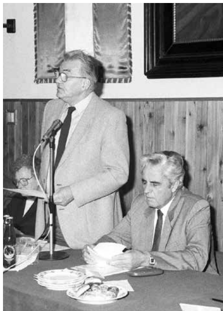
A MEDOSZ elnökségi ülésén

letet. E tulajdonjogi problémák, a birtoklással és a hasznosítással együtt, nyugodtan mondhatjuk, nemzetközi problémát jelentenek.