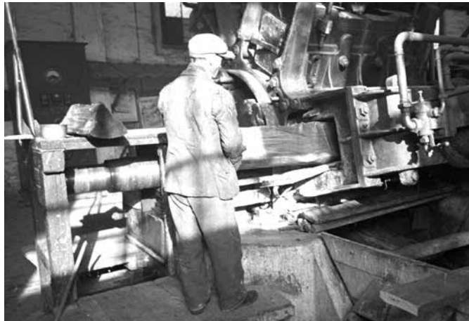
Aprítógép a vásárosnaményi gyárban

A fizikai dolgozók vagy az akkori szóhasználat szerint „erdőgazdasági munkavállalók”, karácsonykor részesülhettek segélyben. Azok kaptak segélyt, akik legalább 2 hónapon keresztül vagy legalább 400 munkaórán erdőgazdasági munkát végeztek. A teljesítménybérben dolgozók átlagos napi keresetük hatszorosát, órabéres dolgozók órakeresetük 48-szorosát kapták karácsonyi segélyként.