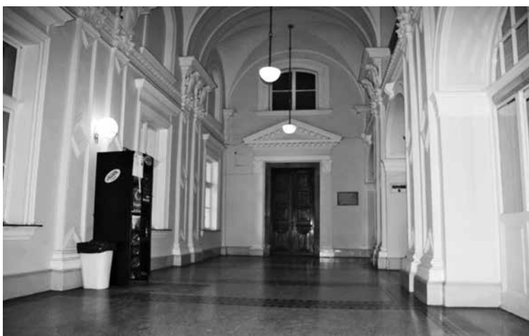
Az egykori szakszervezeti könyvtár bejárata az Agrárpalotában

Végezetül annyit szeretnék mondani, hogy a kormány mindent elkövet annak érdekében, hogy azokat a jogalkotásokat, törvényeket és kormányrendeleteket, amiket még meg tud az elkövetkező időszakban hozni, e parlamenti cikluson belül, azt elősegítse. Ez vonatkozik természetesen a