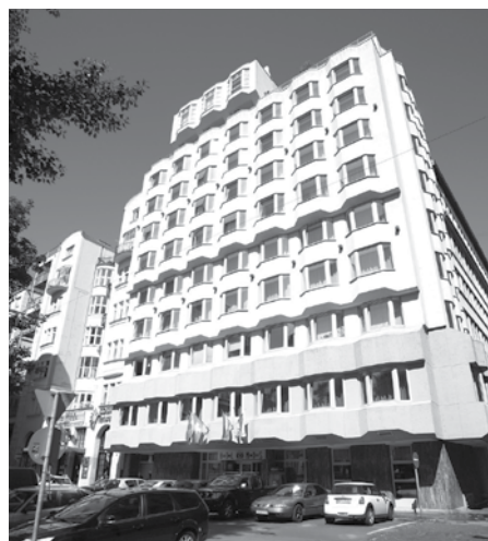
A MEDOSZ Jókai téri székháza

Az OEE az erdészeti műszaki értelmiség kollektív ágazati érdekképviseleti szervezete volt, ma is az. Más nevű és más típusú érdekképviselet-érdekvédelmi szervezet nem merül