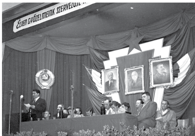
A MEDOSZ első országos tanácskozása

A 3 éves tervben a helyreállítási munkák domináltak. A MÁLLERD sokirányú szakigazgatási tevékenységében helyet kapott az emberről történő gondoskodás is. »Ha tehát állandó foglalkoztatást tudunk teremteni megfelelő szociális