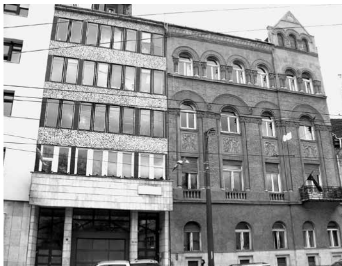
Az egykori MÁLLERD központ épülete

A MÁLLERD foglalkozott az erdészek régi kívánságával, az erdészeti középiszkola felállításának kérdésével is (Osváth, 1948). A Földművelésügyi