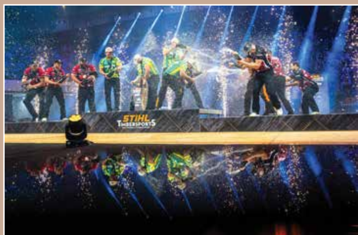
A Stihl Timbersports® világbajnokság győztesei a pezsgőfürdőben