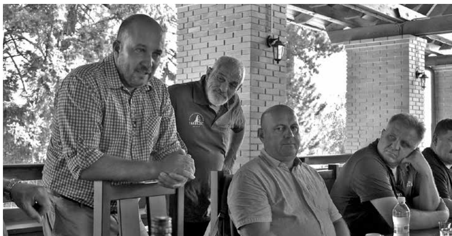
Beszélgetés a TAEG Erdők Házában