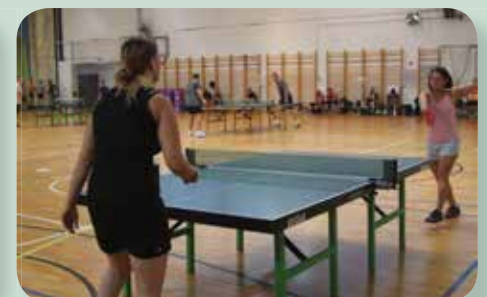
Vérre menő küzdelem