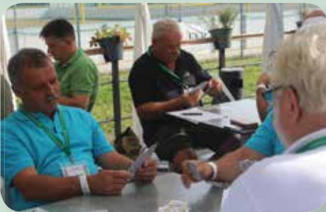
Az ördög bibliája