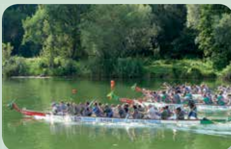
A habok hátán