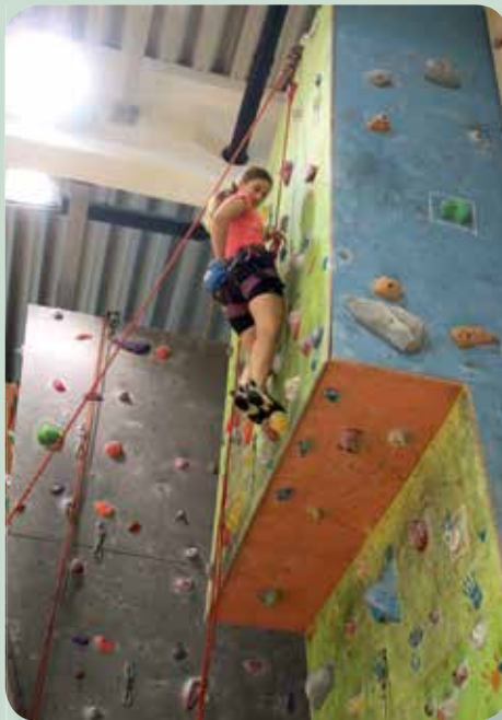
A hölgy falra mászott