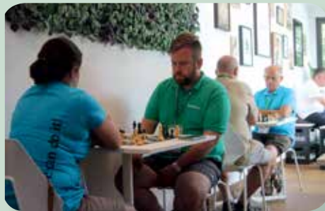
Küzdelmek a sakktáblán