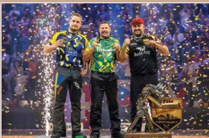
A Stihl Timbersports® egyéni világbajnokság érmesei