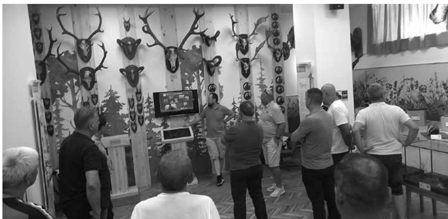
A trófeák tanulmányozása

is jelentkezik a klímakihívás: emelkedő hőmérséklet, más csapadékeloszlás, rövidebb hóval borított időszak, s hogy mindez elsősorban a hagyományos csemetenevelésben jelent nehézséget. Ezért is a csemetetermesztés, -felújítás, -telepítés képezte az érdeklődés tárgyát. No meg a környezet-, illetve a természetvédelem,