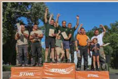
A csapatverseny dobogósai