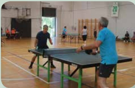
A kaucsuklabda mesterei