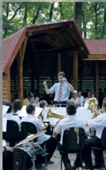
Őszel Muzsikál az erdő