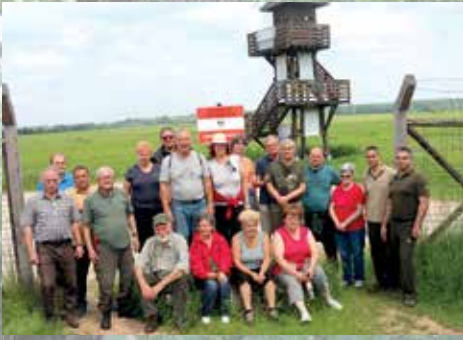
A magyar-osztrák határnál csoportosulunk