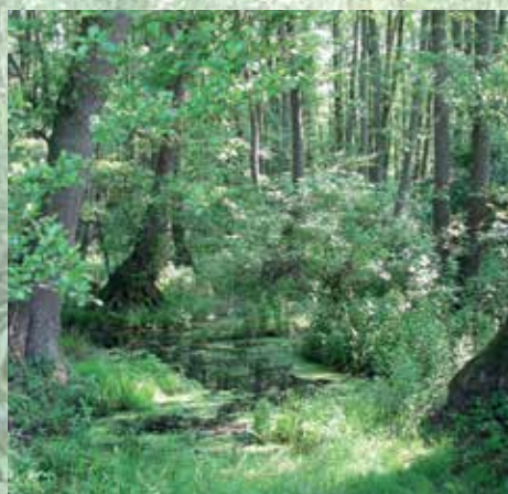
A Csikos-erdő lábas égerei