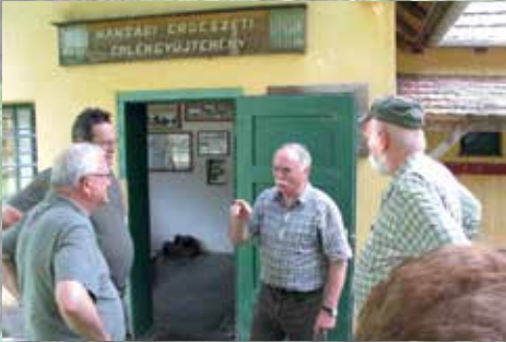
A királytői Hansági Erdészeti Emlékgyűjtemény előtt