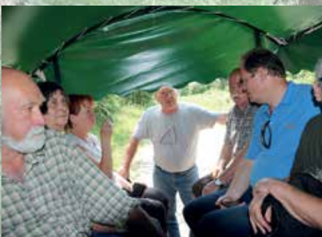
Kocsikázás Göbös-major körül