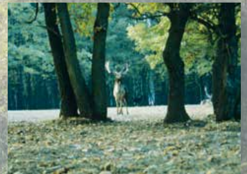
A DALERD egyik büszkesége a „fekete” dámvad geszti családi fészkenél