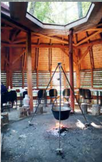
A bogrács magánya