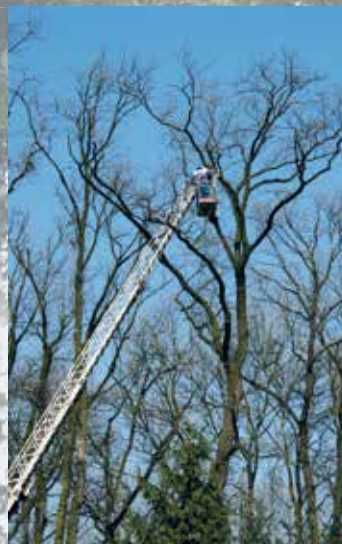
Folyik a veszélyelhárítás