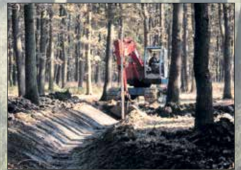
Készül a csatorna az erdőt éltető víznek