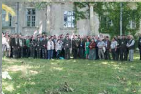
A 149. vándorgyűlés egyik csapata a Tisza-grófok geszti családi fészkenél