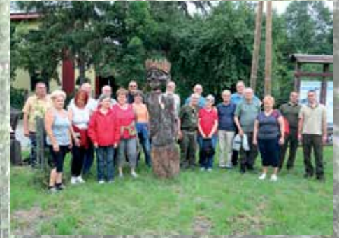
Királytónál körülvettük Übü királyt