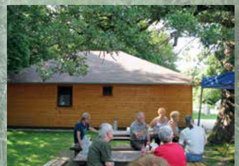
A Göbös-majorban vacsorára várva