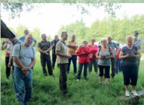
Ismerkedünk a Csikos-erdő védett lábas égereivel