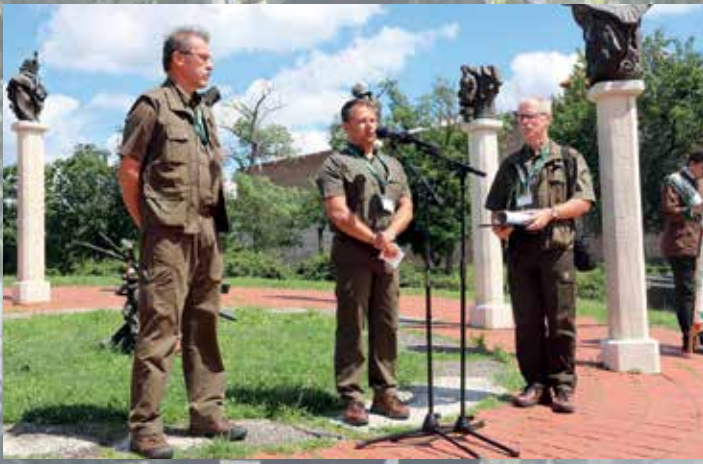
Búcsú a 149. vándorgyűlés résztvevőitől