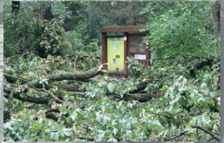
Viharkár a Városerdőn 2019 júliusában