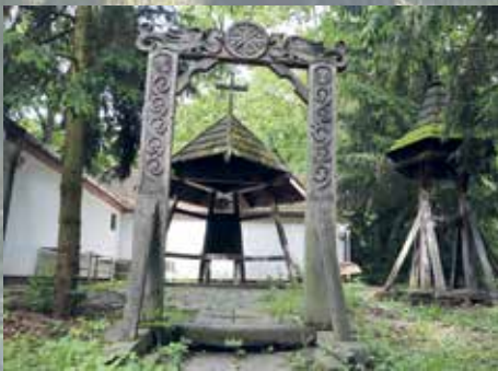
A megmentett régi kápolna